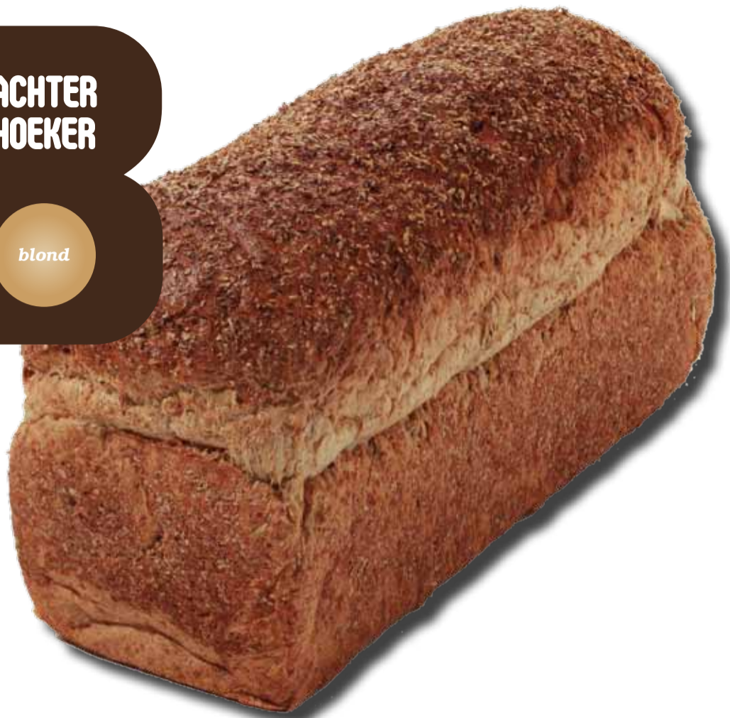
Achterhoeker Blond Licht meergranenbrood gedecoreerd met heerlijke tarwezemelen.